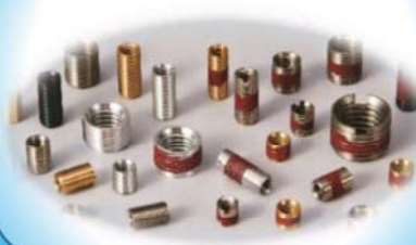
インサートナット