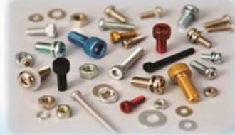
金属ネジ・ボルト・ナット