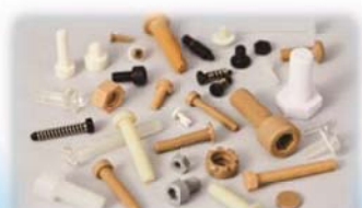
樹脂ネジ・ボルト・ナット