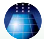
太陽電池/燃料電池

プリント可能素材: プラスチック・ガラス・金属シート・シリコン・細胞膜・ゲル・薄膜・紙など