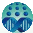
ライフサイエンス