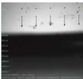
吐出観察カメラで撮影