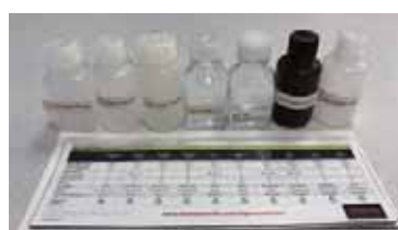
ボトルサンプルパック

※各種材質で作られた60 mLサイズの ボトルサンプルパックもご希望にあ わせてお送りさせていただきます。