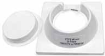
希望小売価格 49,000円(50枚入)