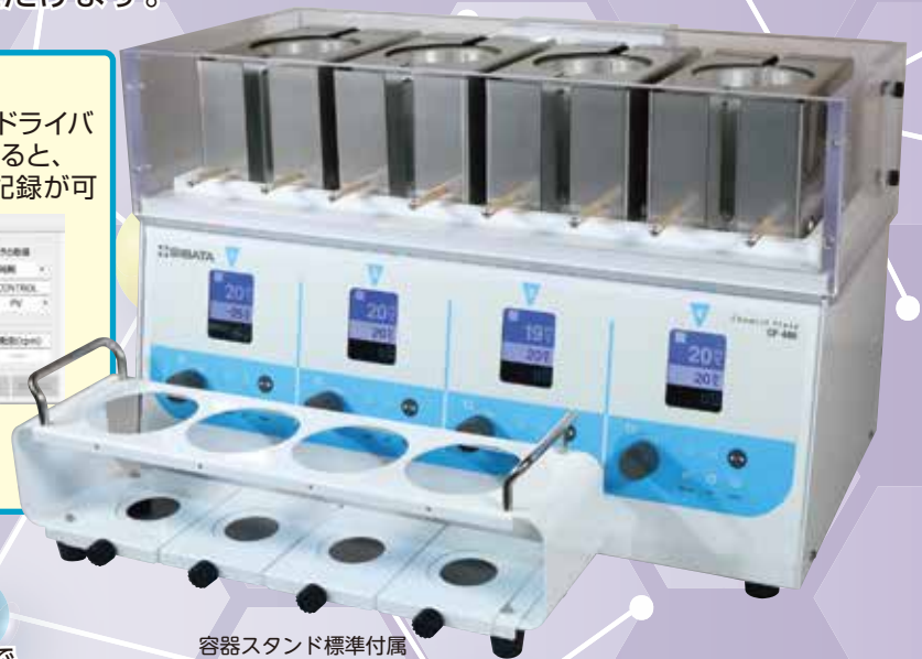
容器スタンド標準付属