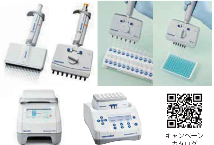
キャンペーン カタログ

さらに！ レーザー刻印ピペットが当たるフォトコンテスト も実施します！（開催期間：2021年10-11月末）