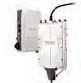
ピック&プレースロボット PPR