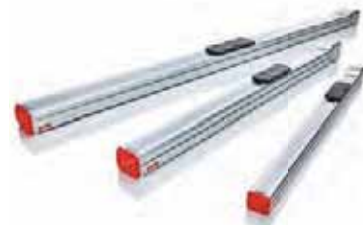
電動アクチュエータ KSFシリーズ