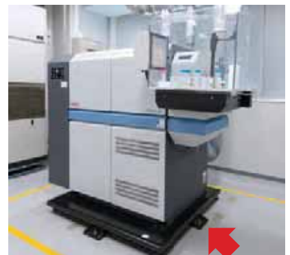
サーモフィッシャーサイエンティフィック株式会社 (高分解能ICP質量分析)