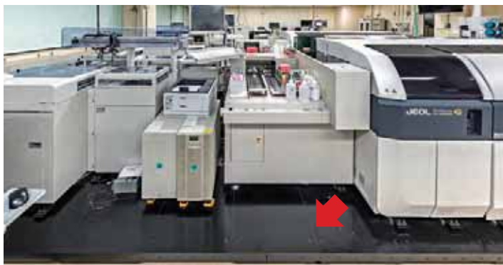
大分大学医学部附属病院 (生化学検査機器)