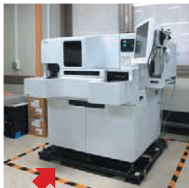
東北大学病院 (血液分析装置)