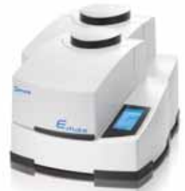
高エネルギーボールミル Emax

こちらに掲載の機器はもちろん他にも多数デモ機を取り揃えております。ご希望の方は下に掲載しているお申し込み手順に沿ってお申し込みください。