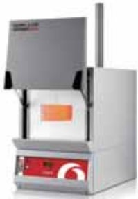
灰化炉 AAF 11/3