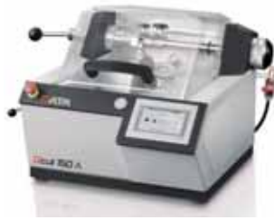
切断機 Qcut 150 A