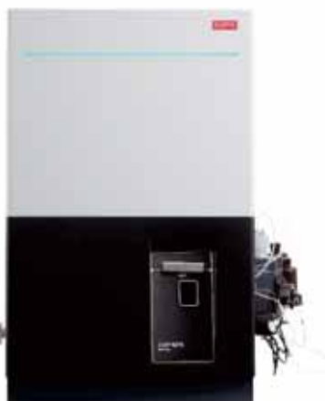
展示製品2：Thermo Scientific™ iCAP™ MXシリーズICP-MS 使いやすさとさらなる高性能