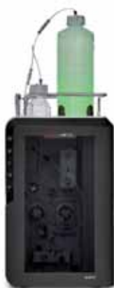
展示製品1：Thermo Scientific™ Dionex™ Inuvion™イオンクロマトグラフィーシステム 高い柔軟性と信頼性

当社は「JASIS関西2025」に出展します！新製品の実機をはじめ、半導体・二次電池材料から規制化学物質（PFAS、RoHS）までの分析をサポートするクロマトグラフィー・質量分析・元素分析技術を展示します。簡単なアンケートへのご回答でノベルティも進呈しておりますので、ぜひ展示ブースへお越しください。