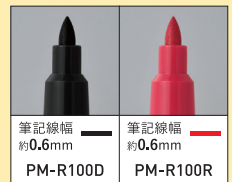
筆記線幅 約0.6mm PM-R100D

●各材料の耐アルコール性や凍結・結露筆記性を保証するものではありません。 ●表面状態により筆記性能、耐アルコール性、凍結・結露筆記性は異なります。