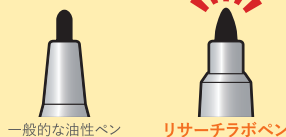
一般的な油性ペン リサーチラボペン

ペン先に硬い素材を用いることで細い形状を実現。にじみにくく、速乾性に優れたインクを使用しているため、マイクロチューブのフタなどの小さな面にも書き込めます。(細字/約0.6mm)