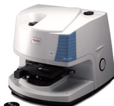
Thermo Scientific™ Nicolet™ iN10 MXイメージング顕微FT-IR