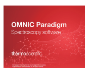
OMNIC Paradigm ソフトウェア