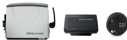
532 nmレーザー、フィルター、グレーティングセット