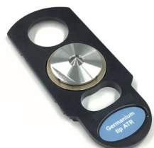
顕微用Tip- (Ge) ATR アクセサリー