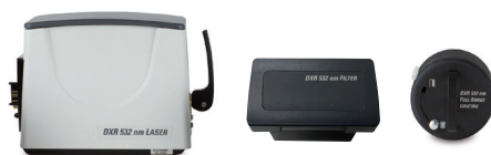
532 nmレーザー、フィルター、グレーティングセット