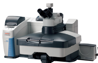
Thermo Scientific™ DXR™3 顕微ラマン