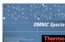
OMNIC Spectra スペクトルサーチ ソフトウェア