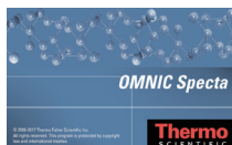
OMNIC Spectra スペクトルサーチ ソフトウェア