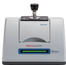
Thermo Scientific™ Nicolet™ Summit™ X FT-IR