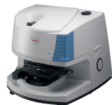
Thermo Scientific™ Nicolet™ iN10顕微FT-IR