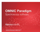
Thermo Scientific™ OMNIC™ Paradigm ソフトウェア