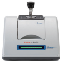
Thermo Scientific™ Nicolet™ Summit™ LITE FT-IR