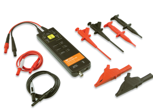
T3HVD1500-200 高電圧差動プローブ

*ソフトウェアはオプションカードにて納品されます。実装には登録手続きが必要となります。